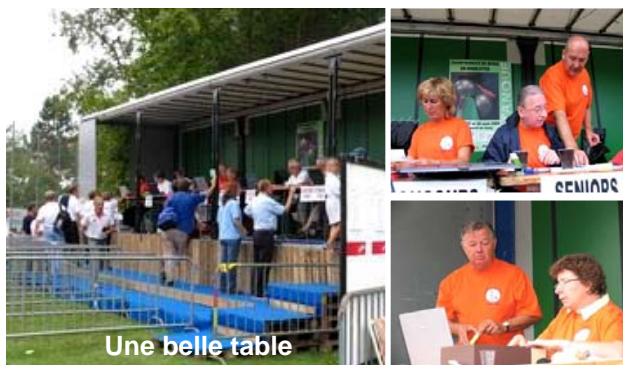
Une belle table

Pour la première fois à Genève, un championnat national se déroulait sur des terrains de football stabilisés spécialement aménagés, à l'exception du revêtement, pour la pratique de la pétanque. Si ici ou là d'aucuns ont pu estimer les terrains pas suffisam-