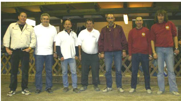
Le président Boschung aux côtés des équipes finalistes