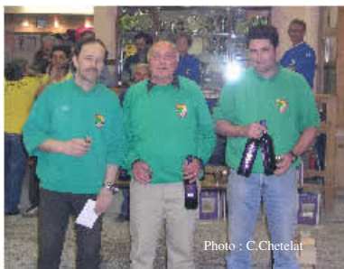
Les Pointeurs Meyrinois

A relever la présence habituelle et toujours sympathique de Villefranche-sur-mer, amis de la pétanque du Camp, société que nous profitons de remercier pour sa bonne organisation.